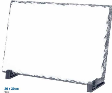
20 x 30cm Gloss